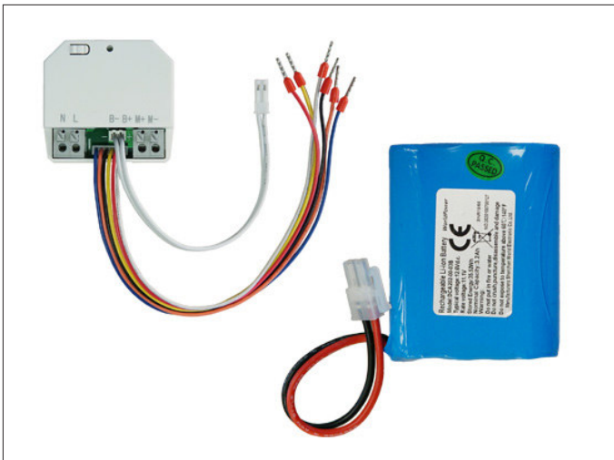
Abb.1: Produktabbildung: UP-Steuereinheit &amp; Akku