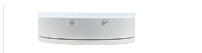
Abb.3: Funk-Sonnensensor Solonto 2 (Seitenansicht)