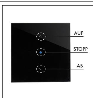
Abb.1: Art. 135300 (Vorderseite)