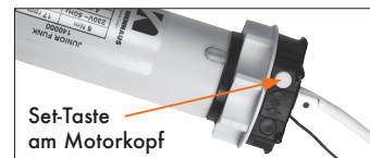
Abb.: Teilausschnitt Motorkopf mit Taste

Zum Einlernen des Master-Handsenders wie folgt vorgehen: