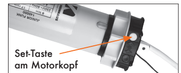
Abb.: Teilausschnitt Motorkopf mit Taste

Zum Einlernen des Master-Handsenders wie folgt vorgehen: